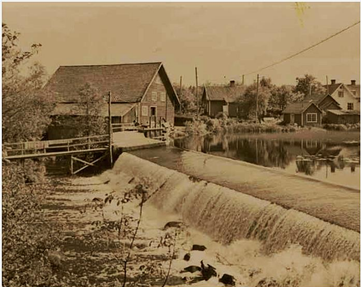
Åbyfors kvarn 1948 sett från NV. På bilden syns överfallsdammen, kvarnrännan samt luftledningarna.

De Fliseryd närliggande (ca 1,5 mil) ortnamnen Hultsnäs, Källtorp, Böta, Värlebo (Verlebo) nämns i handskrivna texten på vykortet. Och utmed Emån som rinner genom Fliseryd går Åbyvägen, förbi det som på satellitbilden ser ut att vara en stor fördämning i Emån vid Åbyfors kvarn. Sydväst om Fliseryd ligger Övre Åby.